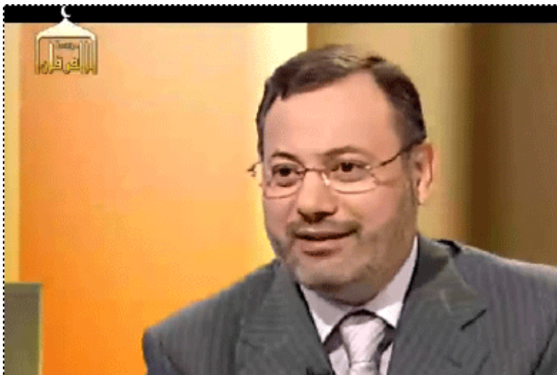
طارق الهاشمي، نائب رئيس المنطقة الخضراء ببغداد: